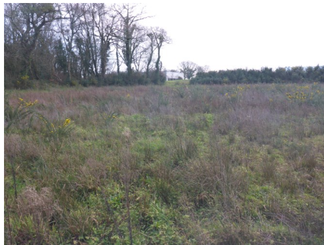
Secteur à dominance d'espèces prairiales

Cinq ans après travaux, l'état fonctionnel de la zone restaurée, même si elle a retrouvé son caractère humide, est donc encore limité du fait de l'appauvrissement en matière organique du sol et sa compaction.