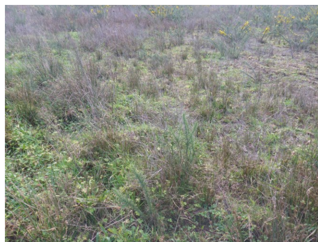
Végétation peinant à reprendre, 5 ans après travaux