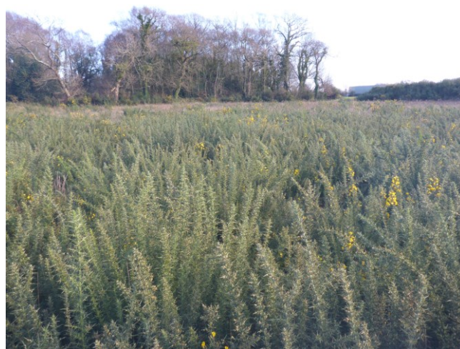
Secteur dominé par l'Ajonc d'Europe